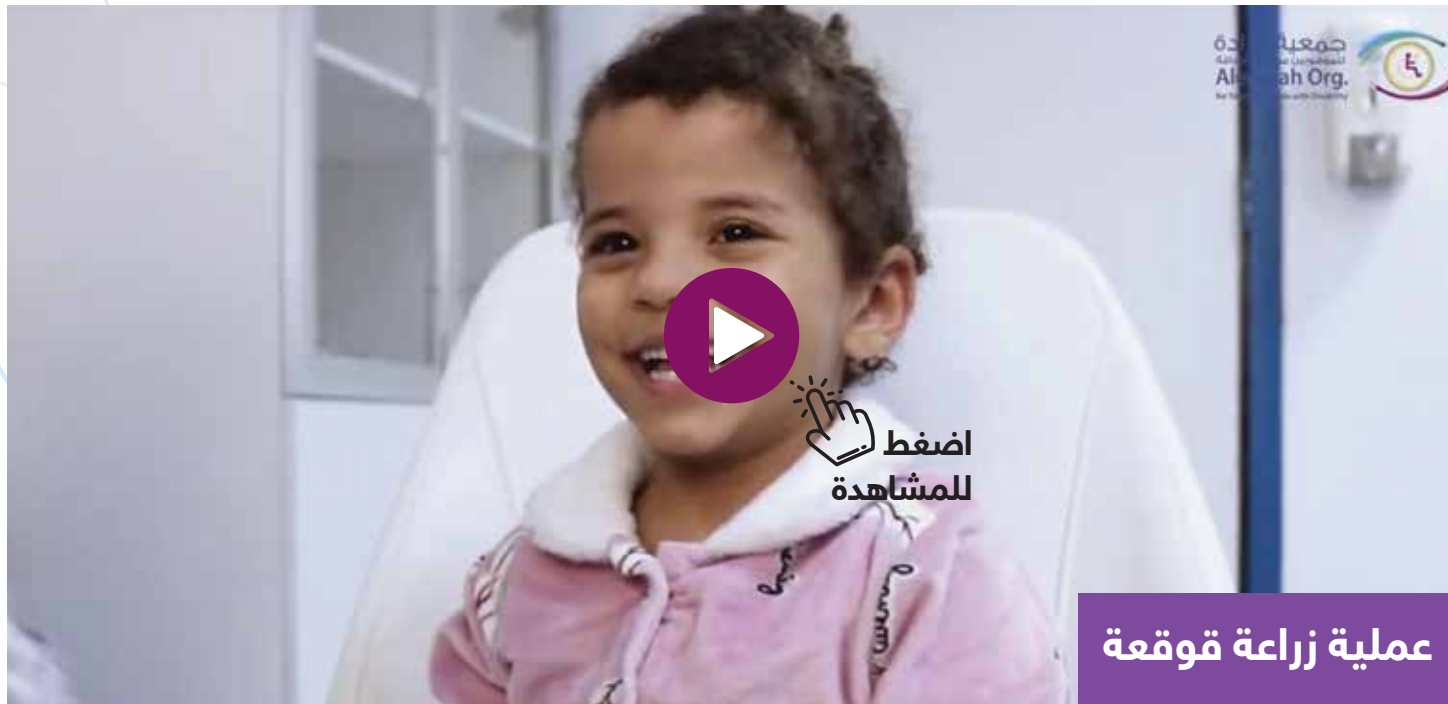
عملية زراعة قوقعة