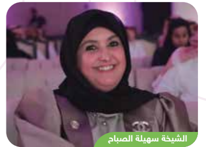
السفيرة سهيلة الصباح