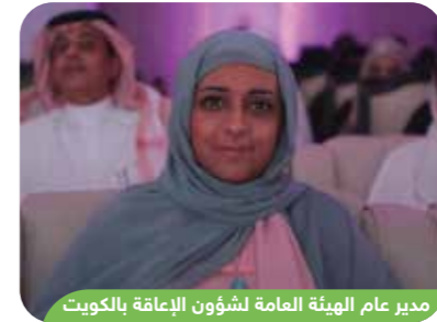
مدير عام الهيئة العامة لشؤون ذوي الإعاقة بالكويت