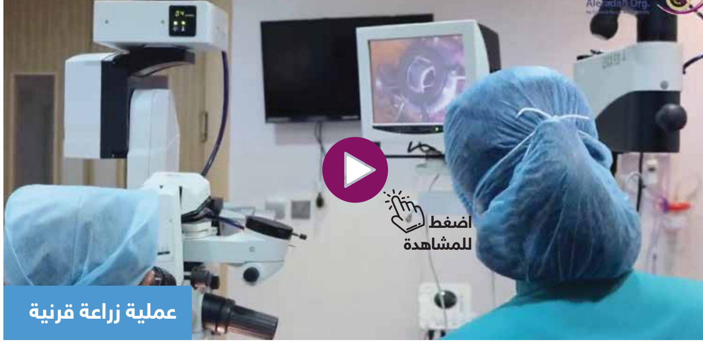
عملية زراعة قرنية

02 الحفاظ على صحتهم عبر علاج إعاقاتهم أو تخفيف حدتها حتى لا تكون عائقاً لهم