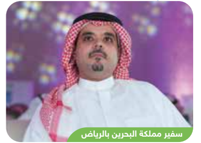
سفير مملكة البحرين بالرياض