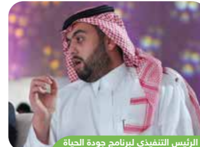
الرئيس التنفيذي لبرنامج جودة الحياة