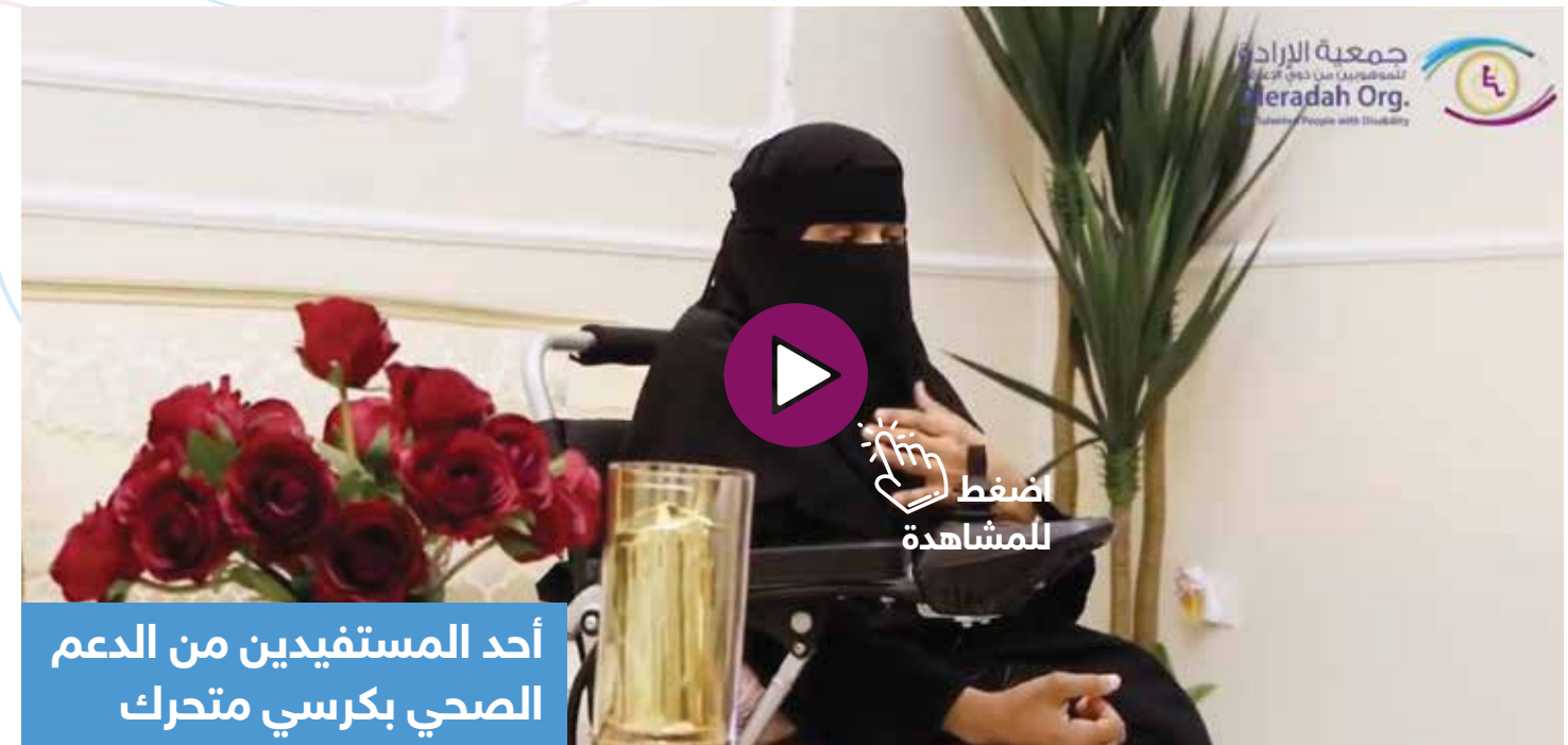
أحد المستفيدين من الدعم الصحي بكرسي متحرك