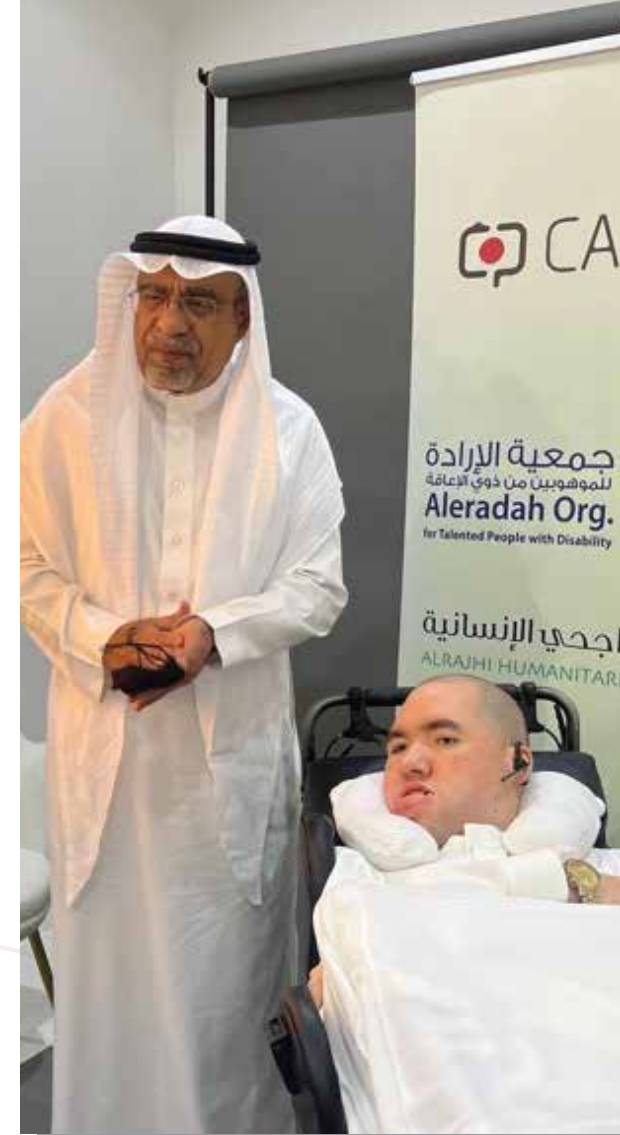
معالي امين المنطقة الشرقية م/فهد بن محمد الجبير

03 توفير مقومات بيئة مناسبة وملائمة لذوي الإعاقة لتطوير مواهبهم