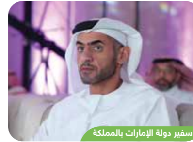
سفير دولة الإمارات بالمملكة

برعاية معالي المهندس أحمد بن سليمان الراجحي وزير الموارد البشرية والتنمية الاجتماعية وبحضور سعادة الدكتور هشام الحيدري الرئيس التنفيذي لهيئة رعاية الأشخاص ذوي الإعاقة، وبحضور عدد من أصحاب السمو والمعالي وأصحاب السعادة السفراء والقناصل.