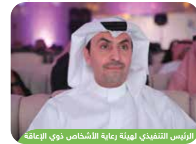
الرئيس التنفيذي لهيئة رعاية الأشخاص ذوي الإعاقة