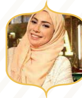
الفنانة دارين البايض