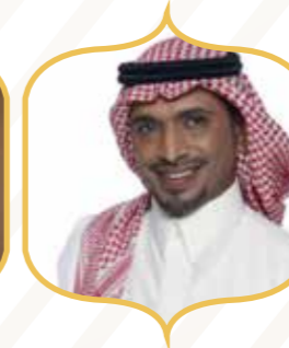
الفنان حبيب الحبيب