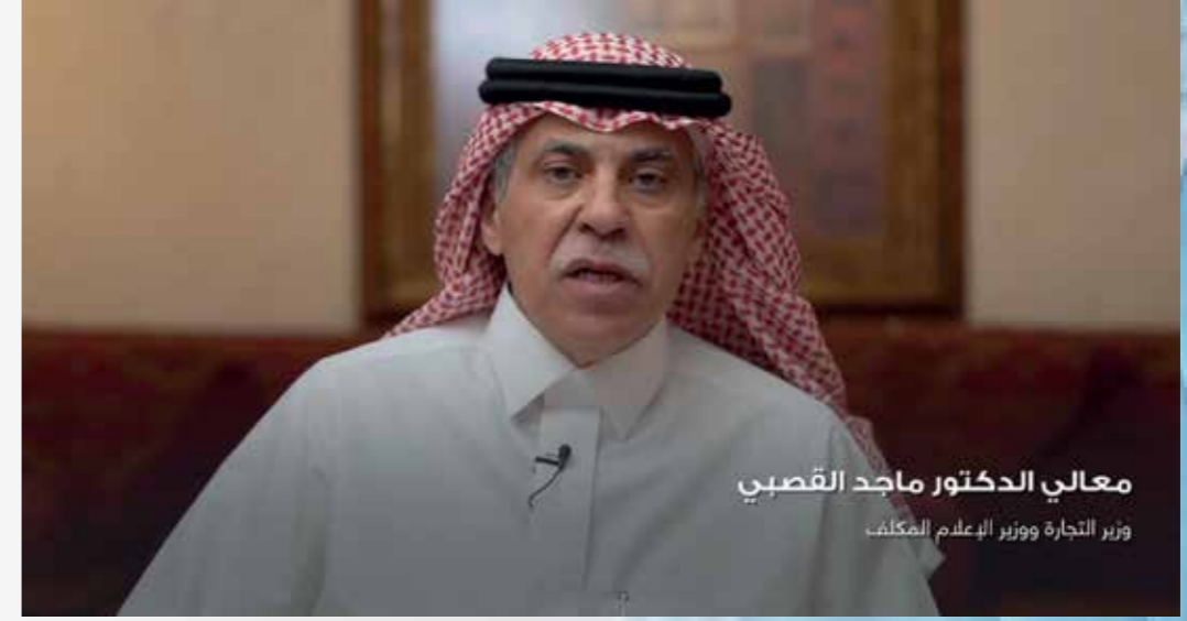
معالي الدكتور ماجد القصبي وزير التجارة ووزير العلوم المكلف

تسليط الضوء الإعلامي على المواهب المسجلة في الجمعية ودعمهم من كافة شرائح المجتمع السعودي