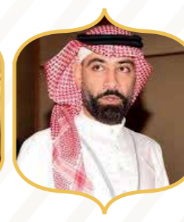
الفنان قصي خضر